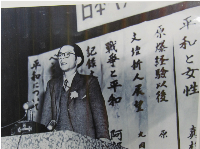
写真4：講演中の原民喜 (回覧された写真)