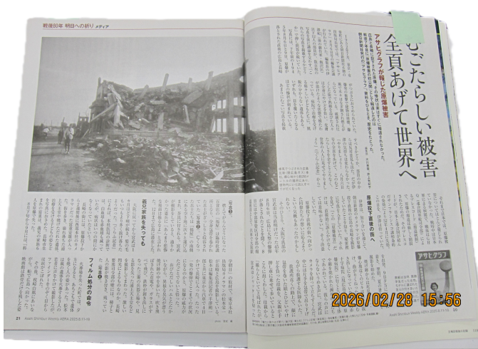
写真2：回覧されたアサヒグラフ

講話の始まりは、広島、長崎への原爆投下に関するアンケート結果の紹介とコメントでした。具体的には、NHKが2025年5月～6月に実施した「戦後80年に関する意識調査」において、広島県民と長崎県民それぞれについて無作為抽出した18歳以上の1800人を対象に原爆投下日を聞いた場合の正答率を紹介されました。広島県民の調査有効数は1097人で正答率が広島（8月6日）について97.6%、長崎（8月9日）について90.3%ということでした。ただ、投下の西暦年あるいは元号まで合わせて聞くと正答率低下が予想されているとも話されました。小中学生については同アンケート結果は未公開ですが、2015年公開の広島市教育委員会による同様の質問（ここでは広島投下の年月日を問う）に対しては、広島市の小学4～6年生および中学生の正答率がそれぞれ75%および78.3%ということでした。しかしながら、原爆がどこから運ばれてきたか、という質問になると根拠のない回答が殆どであったということを踏まえ、原爆投下対象がなぜ広島や長崎になったか、などについても合わせて事実を正確に伝える必要性を強調されました。このようなデータを知って当方は少なからずショックを受け、正答率は決して高くない、もっと知らせなければ、という思いが消えませんでした。さらに、1945年2月4日から8月6日までの原爆投下に向けた米英ソの動き、8月6日の午前0時37分から原爆炸裂の8時15分さらに午後1時58分までの米軍爆撃機エノラ・ゲイの動きについて、詳細なデータを提示しながら説明してくださいました。また、「原爆被害の初公開」なるタイトルで悲惨な被爆の実像を明らかにしたアサヒグラフの記事について雑誌の実物を示しながら紹介されました（写真2、写真3）。これらのこともアンケートに関するお話と共に強く印象に残っています。