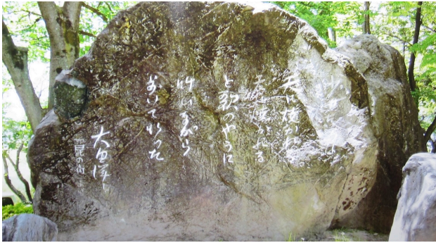
写真7：大田洋子文学碑